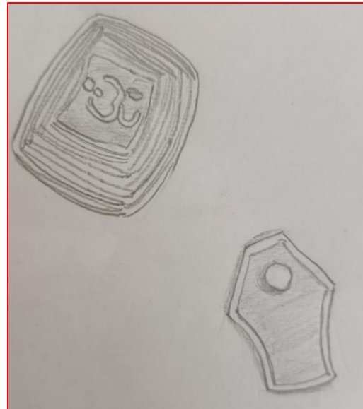
చిత్రం 2 - ప్రణవ చిత్రం, పానవట్టంతో కూడిన శివలింగం తిరిగి గీయబడినవి.