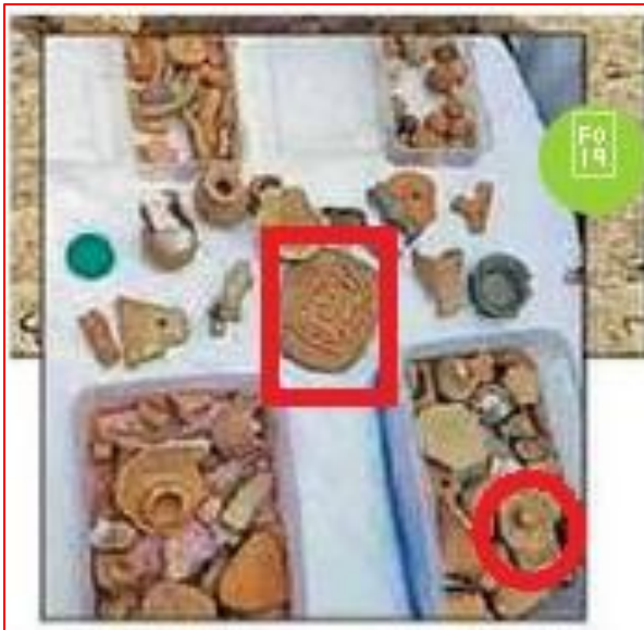
చిత్రం 1 - త్రవ్వకాలలో బయటపడ్డ కొన్ని వస్తువులు: ప్రణవ చిత్రం, పానవట్టంతో కూడిన శివలింగం ఎరుపు రంగుతో ప్రముఖంగా ప్రకటించబడ్డాయి.

శివలింగం నిర్గుణ పరమాత్మకు సూచకం అని శివపురాణంలో ఉంది. శివలింగం సృష్టి, స్థితి, లయాలు చేసే త్రిమూర్తులు బ్రహ్మ విష్ణు మహేశ్వరులకు సూచకం. శివలింగం ప్రకృతికి, చైతన్యానికి సూచకం. ఈ బ్రహ్మాండం శివలింగం రూపంలో ఉంది అని కూడా ఉంది. ఇలా ఈ ప్రణవం, శివలింగం, వేదం, హిందూమతం ఏదెనిమిది వేల సంవత్సరాల నుండి ఉన్నాయని తెలుపుతున్నాయి.